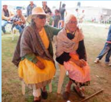
CALIDAD DE VIDA

Al proporcionar un simple par de lentes de lectura se puede tener un impacto inmediato y de manera positiva en la vida de las personas, así como en el bienestar de su familia, su comunidad, y en la economía en general.